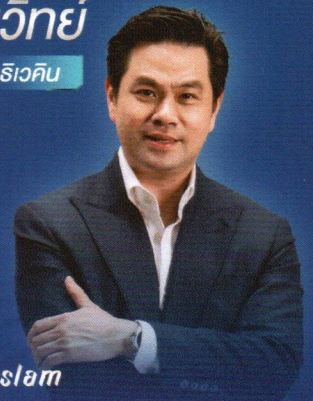
เอี้ยวิทย์