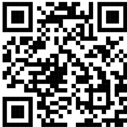
QR - Code ยื่นใบสมัครฯ