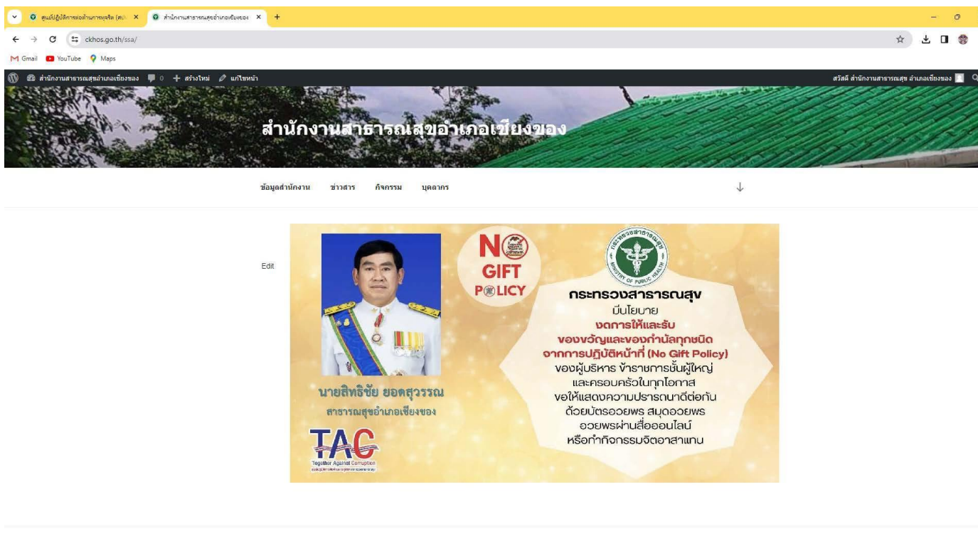
Infographic No Gift Policy ในนามหัวหน้าหน่วยงานอยู่บนเว็บไซต์หลักของหน่วยงาน